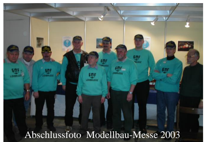
Abschlussfoto Modellbau-Messe 2003