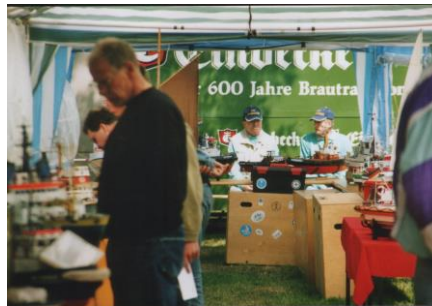
Bei uns im Stand