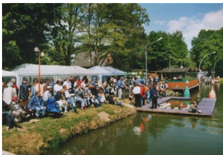
Besucher beim Schaufahren